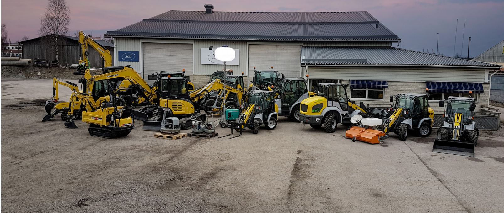
Det är viktigt att kunderna ska kunna se och testa olika maskiner på plats.

OMRÅDET OCH LOKALER HAR ANPASSATS OCH SKRÄDDARSYTT. ATT VI HANDLAR MED KVALITETSPRODUKTER SKA VARA EN RÖD TRÅD GENOM HELA VERKSAMHETEN.